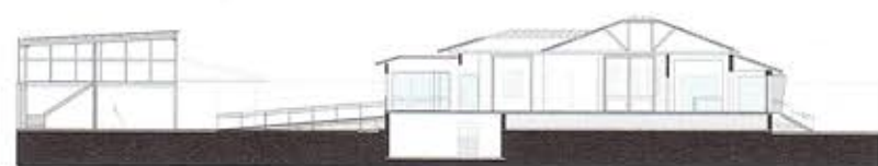
Secțiune longitudinală / Long section