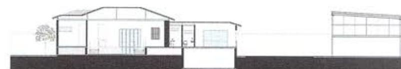
Secțiune longitudinală / Long section